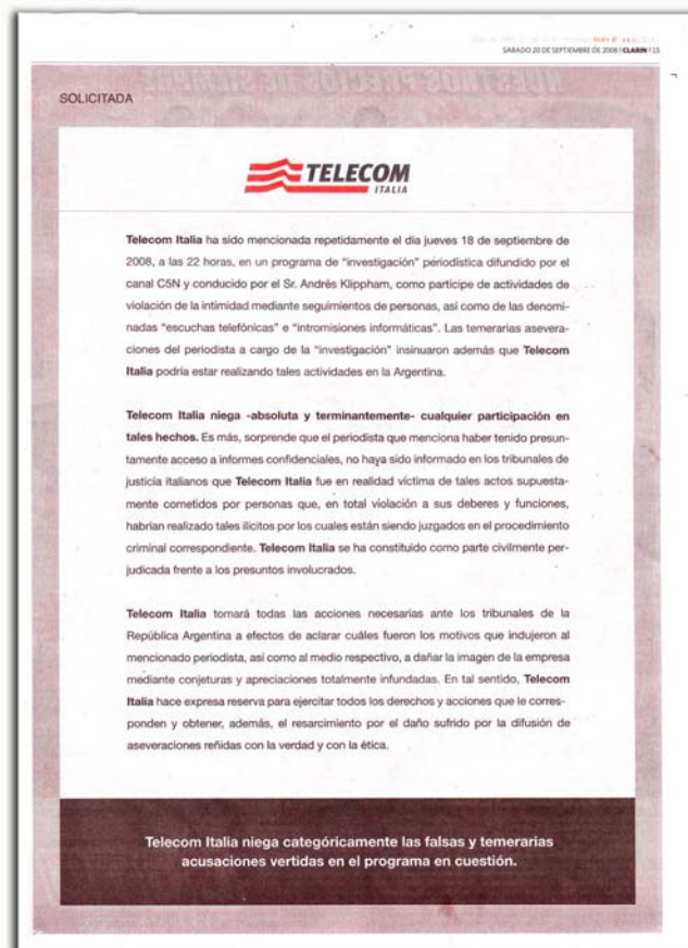
Diario Clarín, 20 de septiembre de 2008

defender con uñas y dientes sus intereses. Un ejemplo de esta guerra es la solicitada que publicó Telecom Italia el 20 de septiembre de 2008 en los diarios de mayor circulación de Argentina y que solo se entiende a partir de las operaciones políticas de su contrincante. En otras palabras: a falta de las “palancas” políticas y contactos periodísticos de que dispone el grupo Werthein en el país, los italianos acuden a los medios mediante avisos pagados en forma de solicitadas para responder lo que ellos interpretan como un juego sucio de sus oponentes. ¿Comunicación comercial? No! A todas luces, comunicación política.